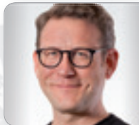
ao. Univ.-Prof. Dr. Risak Institut für Arbeits- & Sozialrecht Universität Wien