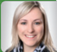
Dr. in Pernkopf Institut f. Verhaltenswissenschaftl. Orientiertes Management WU Wien